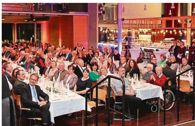
Das PUC bot für den Bürgerempfang die ideale Kulisse.