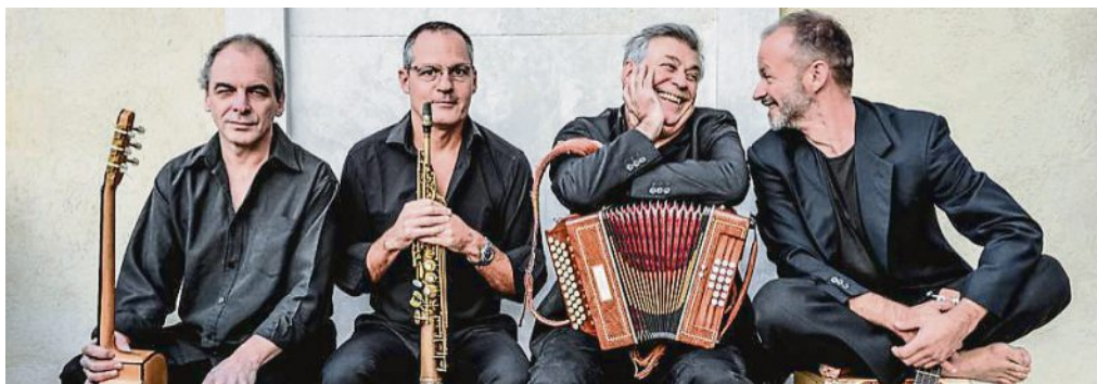
Banditaliana gestalten die zweite Etappe des Bluesfestivals wesentlich mit.

Veranstalter: Stadt Puchheim PUC, Béla Bartók-Saal Normalpreis 25,20 Euro; ermäßigt 23 Euro Festivalticket für beide Tage: 45 Euro