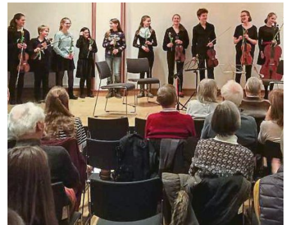
Uhr und 17 Uhr, dazwischen eine literarische Lesung mit Ariane Pestalozzi bei Kaffee und Kuchen.

Der nächste Auftritt der Quartette findet statt am Sonntag, 22. März, im „Literarischen Streichquartett Café“ im Puchheimer Kulturzentrum PUC. Es gibt zwei Musikblöcke mit je drei Ensembles um 15