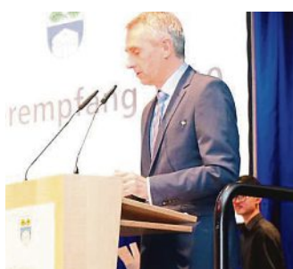
Erster Bürgermeister Norbert Seidl eröffnete den Bürgerempfang 2020.